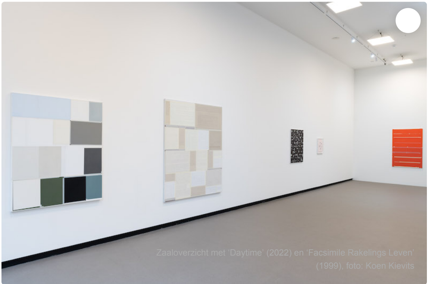
Zaaloverzicht met 'Daytime' (2022) en 'Facsimile Rake's Life' (1999)