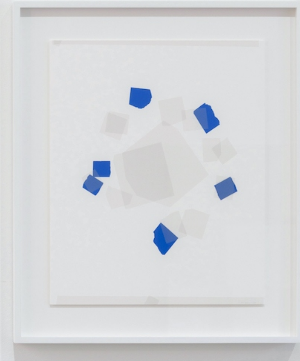
'Around the Middle', 2022, foto: Koen Kievits