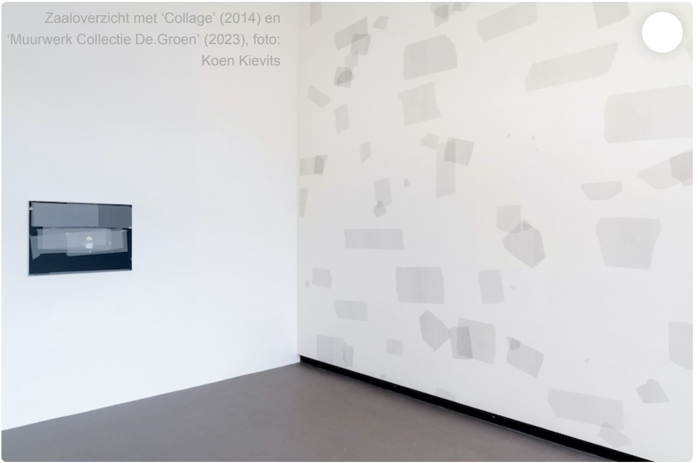
Zaaloverzicht met 'Collage' (2014) en 'Muurwerk Collectie De.Groen' (2023)