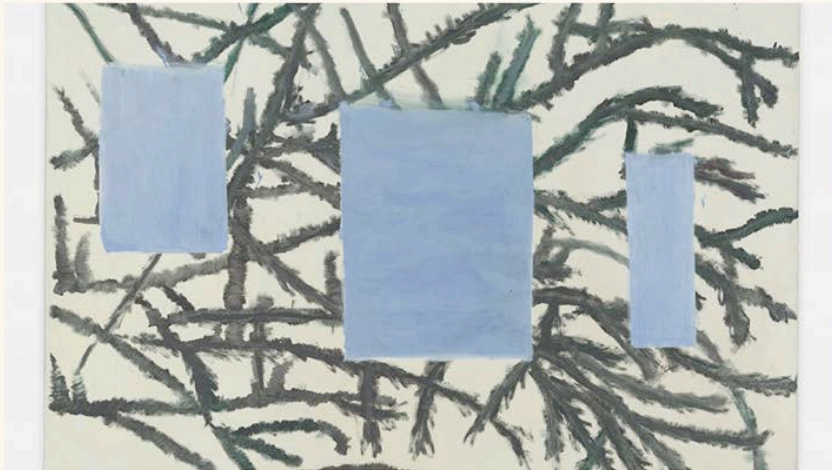
Raoul De Keyser, Bern-Berlin hangend, 1993.

In Mu.ZEE in Oostende gaat een rits kunstenaars met schilderijen en beelden een gesprek aan met Raoul De Keyser. De conversaties zijn boeiend en plaatsen de schilder uit Deinze in een internationale context.