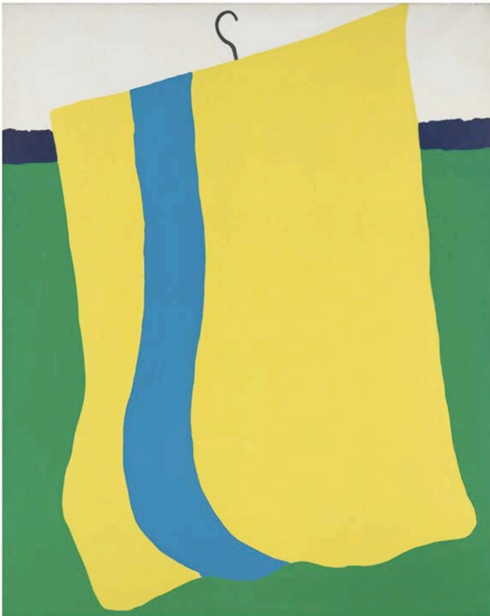
Raoul De Keyser, Bag, 1969.