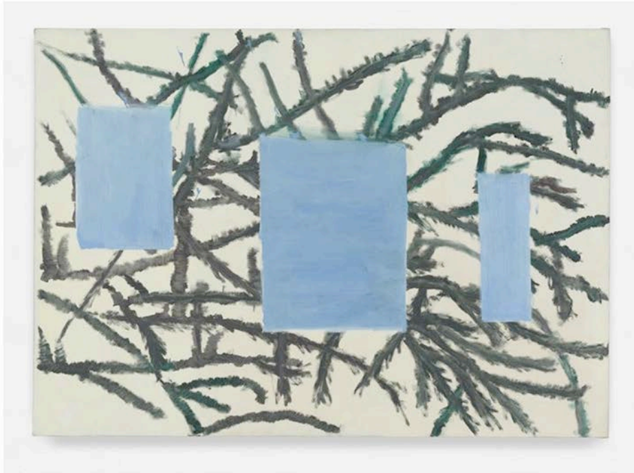
Raoul De Keyser, Bern-Berlin hangend, 1993.

Wat het werk van De Keyser zo goed maakt is dat het een ode vormt aan de subtiliteit. De man zei heel veel met erg weinig middelen. Zijn doeken ogen abstract, maar zijn doorgaans gebaseerd op motieven uit zijn dagelijkse omgeving zoals de kalklijnen op een voetbalveld, een deurklink of een boom in de tuin. Net als Roger Raveel vierde hij de alledaagse dingen in het leven. Hij creëerde op speelse wijze een oeuvre van voornamelijk schilderijen waarin dagdromen centraal stonden. Toevallige ontmoetingen, fouten en onbedoelde gevolgen, het komt allemaal terug in zijn werk.