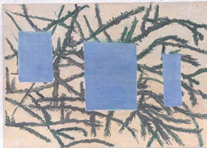
De takken uit het lexicon van Raoul De Keyser. © Family Raoul De Keyser

Friends in a field Muzee, Oostende tot 21/5. ★★★★