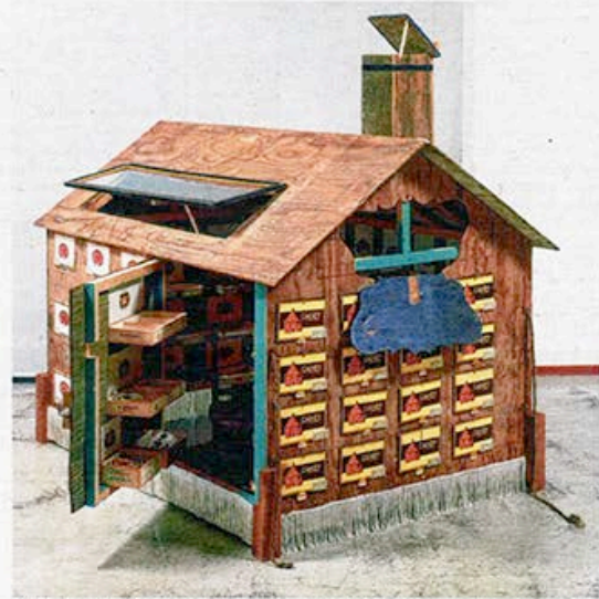
Fragile toont veel herinneringen, gedocumenteerd in foto's, maquettes en souvenirs.

Het is een motief dat vaak opduikt in deze tentoonstelling: een afbakening als symbool van de beslotenheid van de gemeenschap, van de onmuurde tuin waarboven Van Caecckenbergh oude bomen