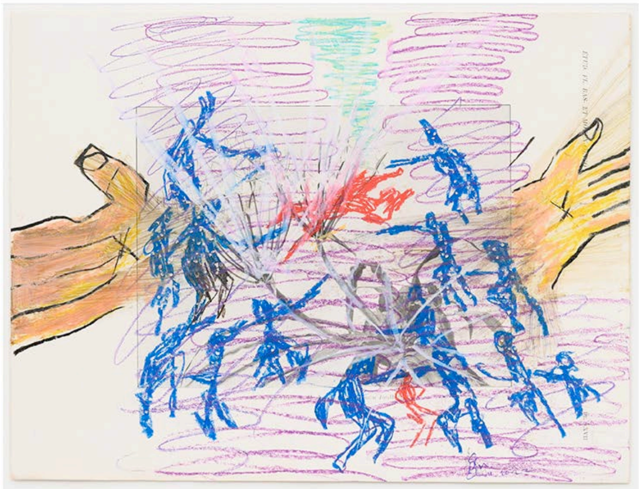
Pélagie Gbaguidi, Chaine Humaine , 2022, waskrijt en kleurpotlood op papier, 27,5 x 36,5 cm.

KW: Taal in ruime zin is ook belangrijk in je werk.