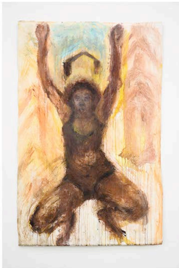
Pélagie Gbaguidi, Le jour se lève: Body Archive , 2021, acrylverf en pigment op canvas, 210 x 135,5 cm.