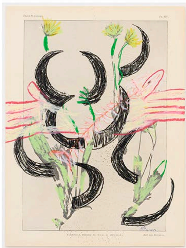
Pélagie Gbaguidi, Chaine Humaine , 2022, waskrijt en kleurpotlood op papier, 36,5 x 27,5 cm.

KW: Je werk vertrekt vaak van onderzoek in de collecties en archieven van musea, zoals het Koninklijk Museum voor Midden-Afrika in Tervuren, of het Nelson Mandela Museum in Mthatha, Zuid-Afrika. Dat zijn plekken die pijnlijke verhalen herbergen.