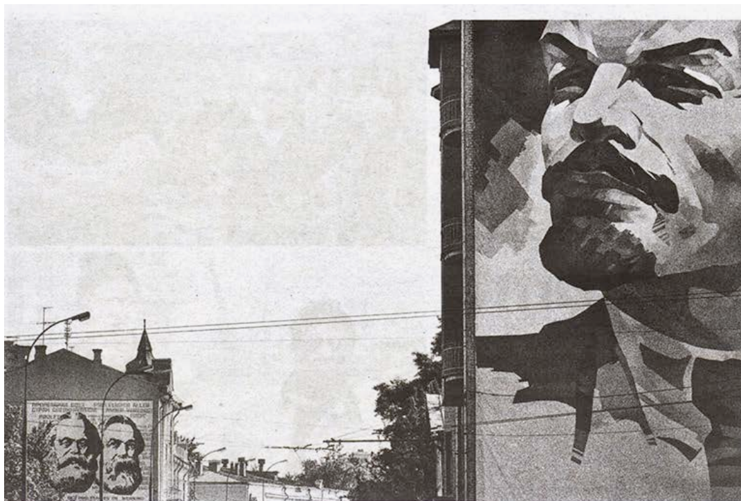
In de serie Lenin, USSR keert Corbijn terug naar het Sint-Petersburg (toen Leningrad) van 1982.

Onder de ironisch te lezen titel IKONEN neemt fotograaf Anton Corbijn een loopje met zijn eigen status. In de Antwerpse Handelsbeurs put hij uit ongezien werk waarin 'herinnering' centraal staat.