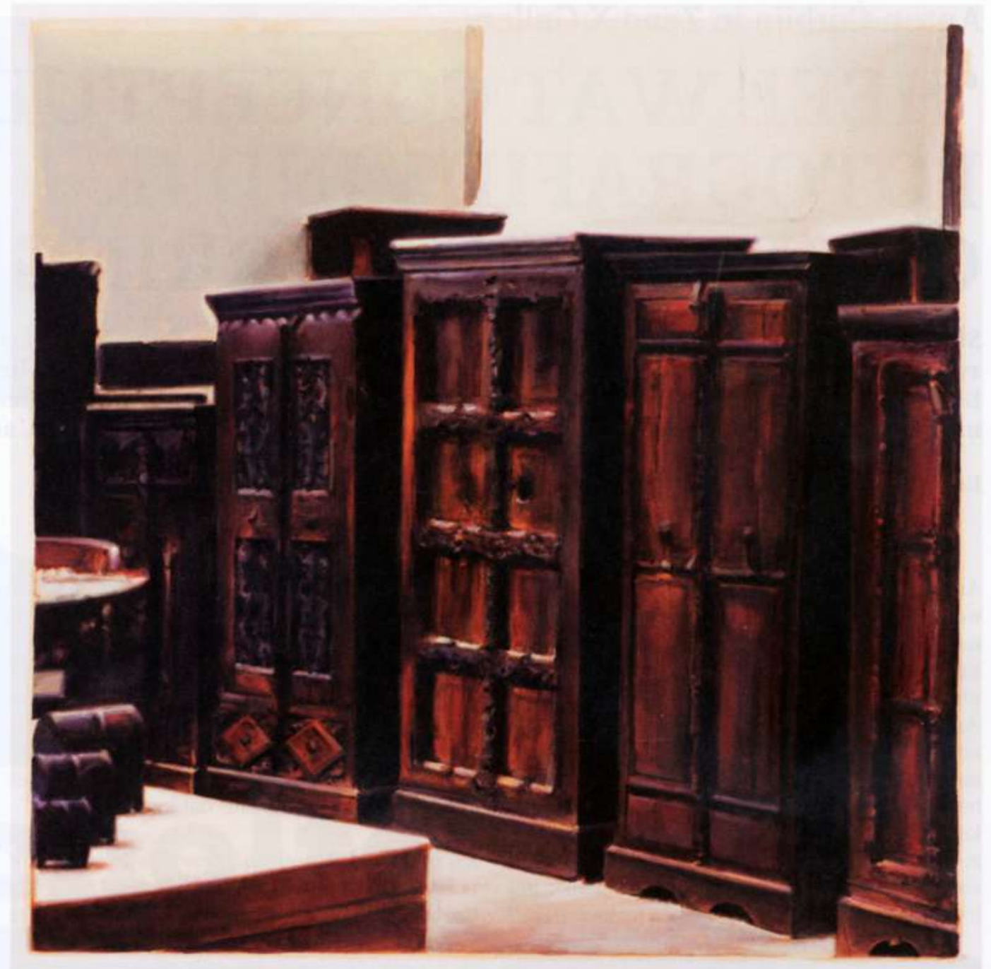
Jan De Maesschalck, Untitled, 2014, 71 x 70,3 cm, acrylic on paper