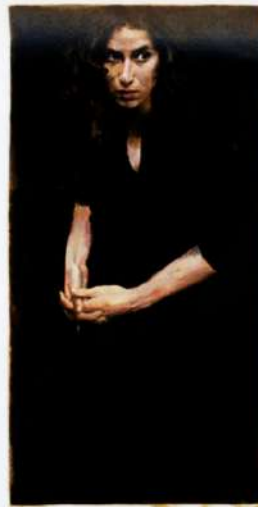
Jan De Maesschalck, 'Untitled (Waiting room)', 2014, acrylic on paper, 54,7 x 40,8 cm

de zin van: hoe ervaar je 'succes' als kunstenaar? Hoe ver kan je geraken? Wat is de ideale manier om als kunstenaar de ladder op te klimmen? Ofwel al jong met steengoed werk komen, ofwel wachten tot je heel oud bent? Ik ben geen van beide, ik kan mijn werk ook niet vlot uitleggen, ben niet zo'n sterke communicator. Ik denk ook nooit na over het soort werk dat ik maak, in functie van een betere verkoop of zo. Ik koester een grote vrijheid, en die zelfrelativering helpt daarbij. Om het te 'maken' als kunstenaar is er ook vaak geluk mee gemoeid, dat weten we allemaal."