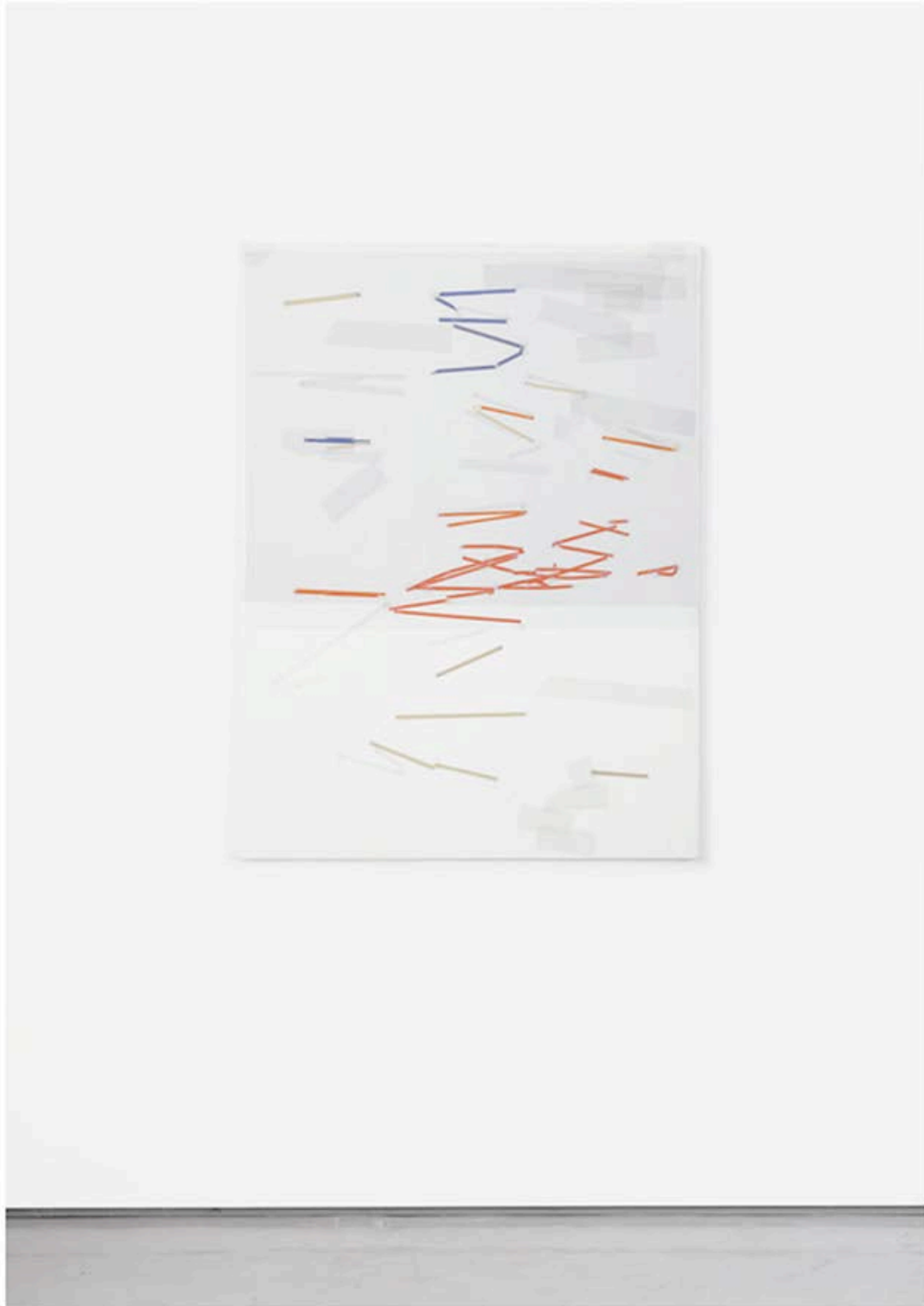
Kees Goudzwaard, Sketch (2018). Olieverf op canvas, 120 x 90 cm.

Het gaat om dat wat zich tussen de regels afspeelt, in het wit van de bladspiegel