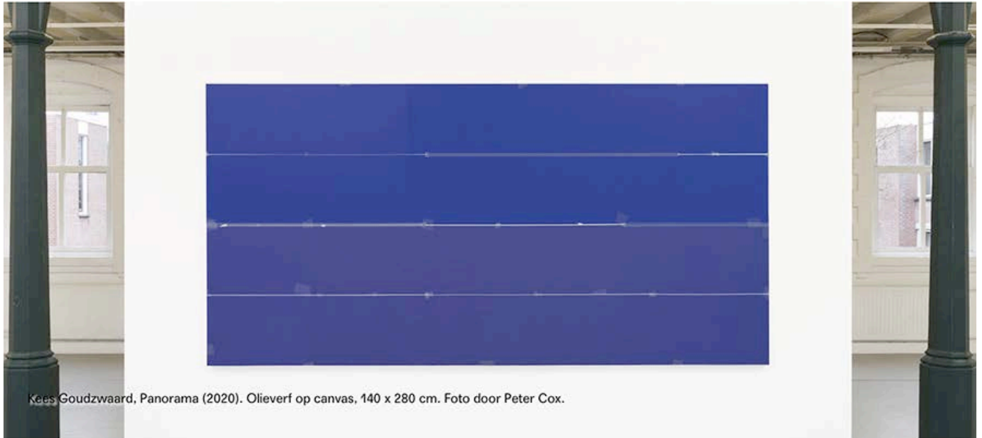
Kees Goudzwaard, Panorama (2020). Olieverf op canvas, 140 x 280 cm. Foto door Peter Cox.

Köke Linda, 'Poëtische leegte - Kees Goudzwaard in Club Solo'. www.metropolism.com , 14 April 2021.