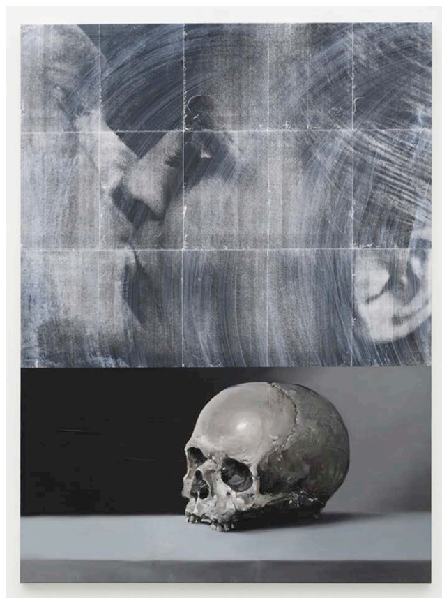
Bart Stolle, Still life with movie projection, 2021, Zeno X Gallery.

MS Het vermogen of het talent om goed te kunnen schilderen, de schilderkunst als vak te beheersen, biedt de mogelijkheid om een overtuigend beeld neer te zetten. Hoe beter een schilderij is gemaakt hoe beter het erin slaagt een idee of een concept over te brengen. In dat geval dient de schilderkunst de boodschap. De schilderkunst zelf is niet de inhoud maar het medium. Als je in een schilderij een sterk politiek of filosofisch statement wil maken zul je een overtuigend beeld moeten scheppen met aandacht voor details. Het beeld is dus niet doel op zich maar dient de inhoud.