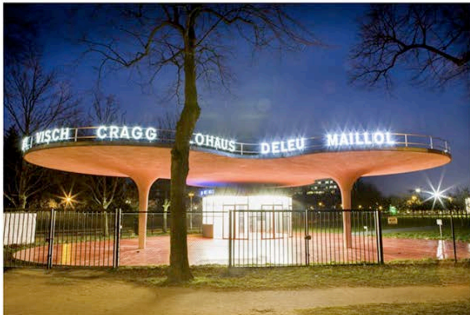
De Artiesteningang in het Middelheimmuseum.

Wat vindt hij van de stadsplanning van Antwerpen? 'Heel gek dat er geen brug is over de Schelde. Je moet altijd een brug kiezen, nooit een tunnel. Niets is duurder dan gaten graven en het is ook gevaarlijker. De voetgangerstunnel is historisch en mooi, maar het prachtige van een brug is dat je de stad al van ver ziet liggen. Denk aan Brooklyn Bridge. Stel je voor dat dat een tunnel was. Daar ga je toch niet lopen, gezellig door een tunnel?'